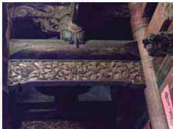
▲傳統平面浮雕圓光。

建築物中間與間隔的隔屏，成了裝飾最好的位置，在中國傳統裝飾意義，如「祈福納祥」而言，它結合了生活與民俗，並兼具傳統民俗文化的生活面，更增添建築藝術在文化表象上的重要意義。