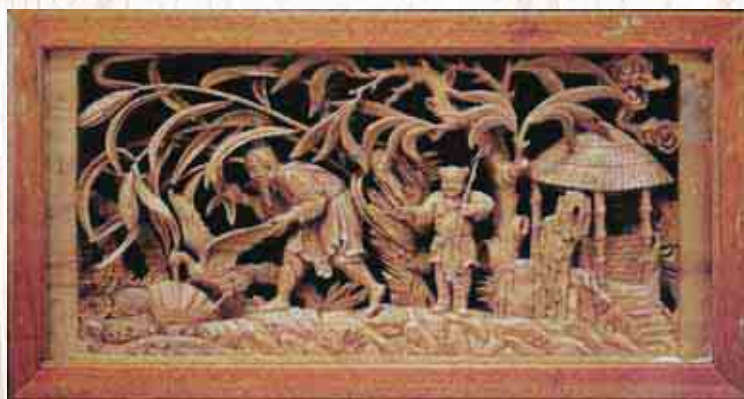
▲漁翁得利（鸕蚌相爭）

「窗花」顧名思義即是用於建築門片、窗櫺中常出現的繪畫裝飾圖案；中式傳統建築中常見以木材雕刻物件取代繪畫，以增添圖案保持之長久性，是空間裝飾最佳選擇，木雕窗花常以傳統圖飾之吉祥圖案做為題材及代表意義，且構件並無太大對建築主體功能之影響。傳統廟宇中門片